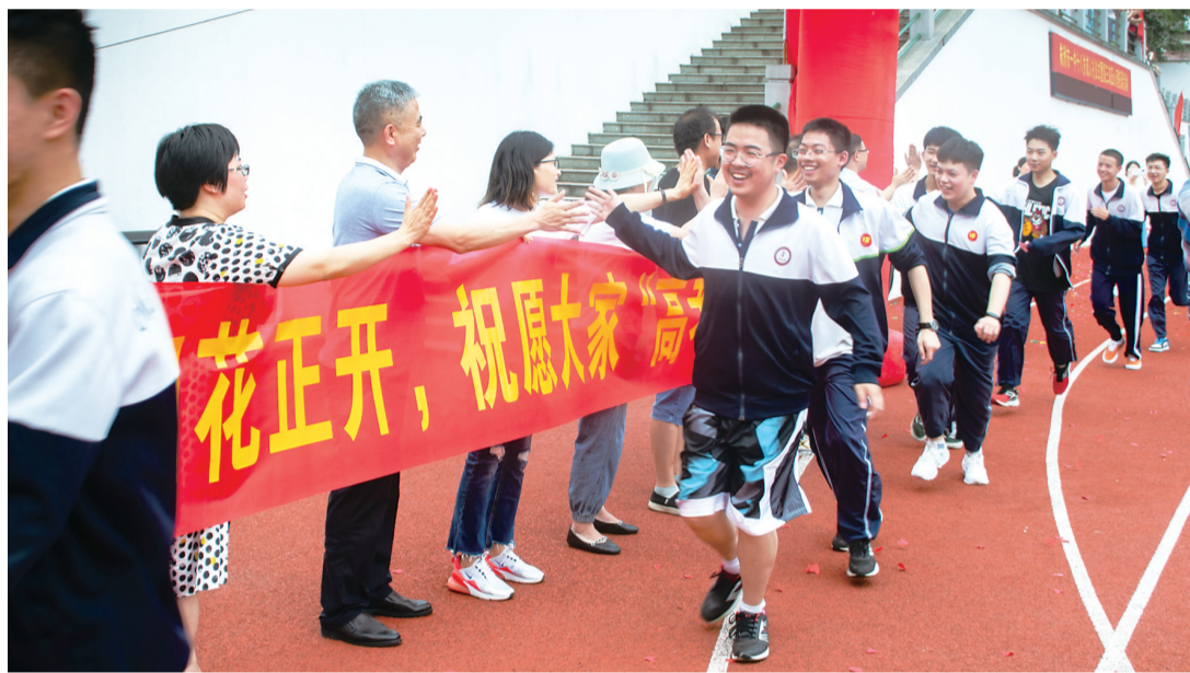
仰望国旗,立下无悔誓言;傲立天地,铭记成人时刻。6月26日下午,株洲市一中为即将迎战高考的高三学子举行十八岁成人礼。图为学生们跨出成人