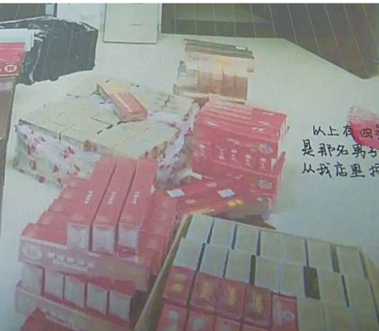
▲警方在张某租赁的仓库中找到的尚未销售的假烟