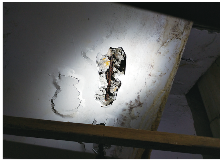
▲黄女士的理发店,楼板渗漏处裸露出钢筋

近日,在株化生活区开理发店的黄女士拨打晚报新闻热线28829110投诉:我开店10多年了,店里的楼板漏水问题也有十多年了,墙皮和水泥层受到侵蚀,现在连钢筋都裸露出来了。我跟房东、物业公司和社区居委会反映过多次,每次都是漏了补,补了又漏,我担心再漏下去,房子的安全会受影响。