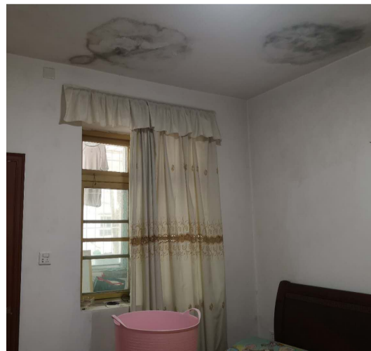
▲三楼马先生家,床上摆着桶子接漏水

当天下午6点,王女士告诉记者,堵塞的主排水管道已经疏通了,自己家里的污水也已经清理干净了。目前,她和3楼的马先生准备一起联系楼上住户,提醒大家不要在马桶内丢垃圾,避免主排水管道再次堵塞,家里再次出现污水横流的现象。