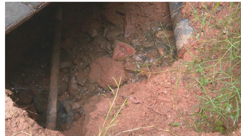
▲小区水管裸露在外