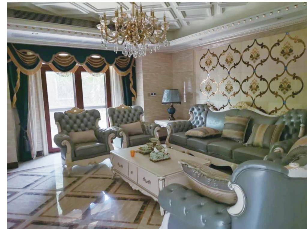
▲本次拍卖成交的房产之一

本报讯(记者 贺天鸿 通讯员 陈定波 张剑)近日,石峰区人民法院在阿里拍卖平台成功拍卖两套与黑恶势力关联案件房产,成交金额达1118.6万元。