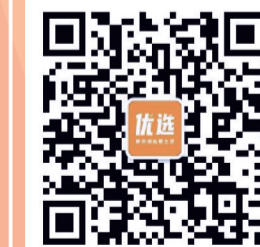
建宁优选官方微信

李子柒、稻香村、天邦伟业、美赞臣、雅培、合生元、惠氏、爱他美、Arla、安满、宜品、小贝高骼、大王、花王、舒比奇、贝亲、BBOX、泰迪熊、爱思贝、小皮、英式、汤臣倍健、同仁堂、童年故事、培芝、拜奥、黄金大地、兰蔻、欧莱雅、悦木之源、资生堂、科颜氏、香奈儿、九阳、格兰仕、美的、美国西屋、韩国大宇、梦洁、罗莱、富安娜