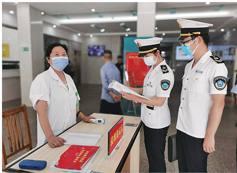
▲执法人员在一家医疗机构进行检查

本报讯(记者 杨凌凌 通讯员 杨加才)近日,北京连续出现新冠肺炎确诊病例。为进一步强化我市疫情防控工作,6月25日,市卫生计生综合监督执法局组成督导组,对辖区内各级各类医疗机构开展明察暗访,督促医疗机构发挥好疫情防控的“前哨”作用。 督导组首先对湖南省直中医院、株洲市三医院的预检分诊工作进行了督导检查,对预检分诊工作值守人员是否接受过最新疫情防控培训、查验居民健康码和流行病学史的工作要求及遇到疑似患者的处置要求进行现场提问,并强调要充分发挥医疗机构“前哨”作用,实现及时发现、快速处置、精准管控、有效救治,做好常态化