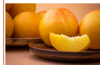
▲晚报实拍 记者 吴琦 摄

两箱样品桃,三个办公室20几个人,没有一个差评,轻咬一口,桃香沾满舌尖,多层次的丰富口感,吃完后,同事们催着上架,线上线下都等着吃这款“黄金油桃”。