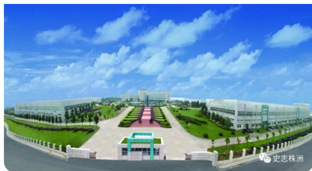
图为株洲硬质合金厂全景图。