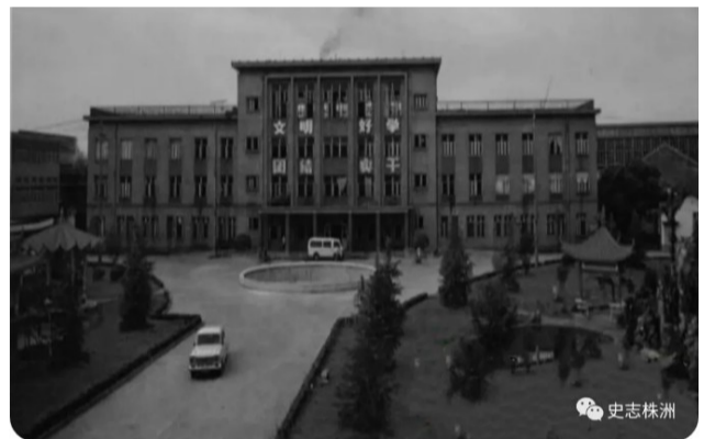
图为株洲芷麻纺织厂老办公楼照片。