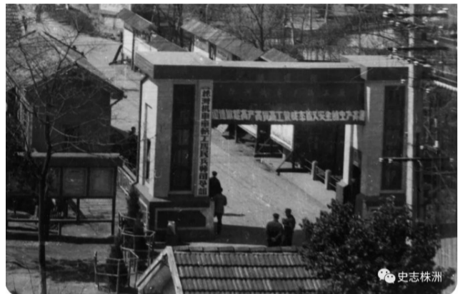
株洲电力机车厂老工厂大门俯瞰照。