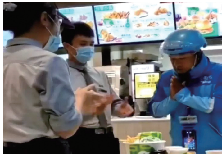
外卖小哥买薯条为自己庆生,快餐店店员一起给他庆生生日。(视频截图)

是火,生日快乐!”番茄酱当蜡烛上的光,是生活对赶路人的丝丝抚慰,愿每一个认真对生活的人,都被生活善待以待。