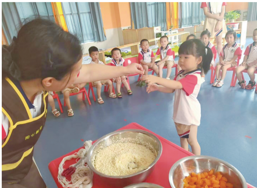
▲昨日,云顶栖谷公办幼儿园,老师将包好的粽子送给小朋友

本报讯(记者 何春林)“五月五,过端午,划龙舟,敲大鼓,你包粽子我跳舞……”昨日,云龙示范区云顶栖谷公办幼儿园开展了“巧手做香囊·自制手工粽”端午节主题活动。