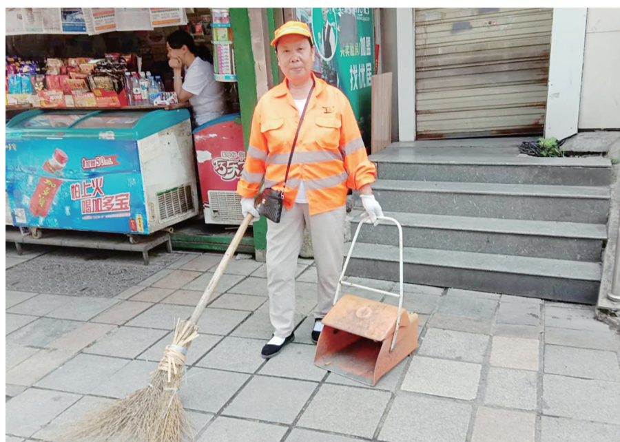
▲工作中的平姨