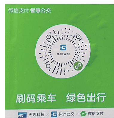
▲扫码即可进入“株洲公交”微信小程序

能。届时,车辆进站后,就可以提前在微信小程序内调用株洲公交的乘车码,上车时直接扫码乘车。