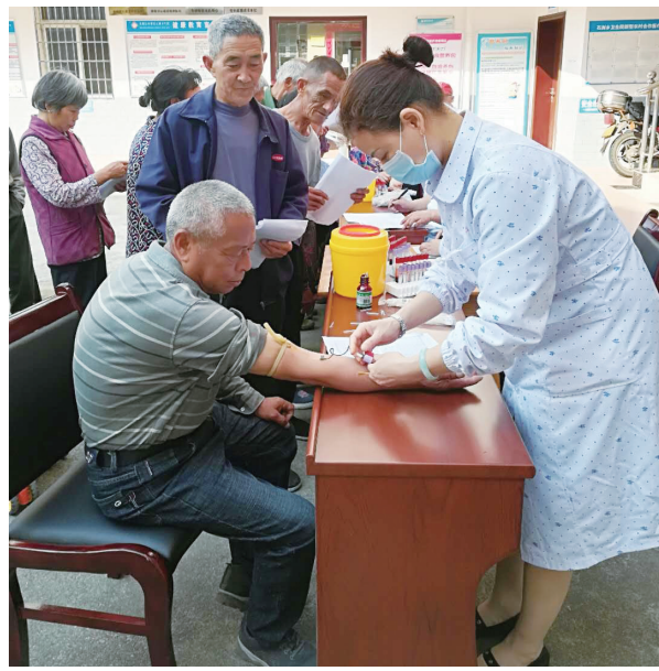
医护人员在霞阳镇为贫困户及老人体检。

在让贫困人口看得起病的同时，该县还着力提高农村地区医疗水平和服务质量，县域内通过全面落实“先诊疗后付费”方式，让老百姓先治病后结算，采取“一站式”即时结算，让老百姓多跑腿，让贫困群众看病更方便、更快捷。今年以来，该县建档立卡贫困人口享受“一站式”结算服务达2036人次。