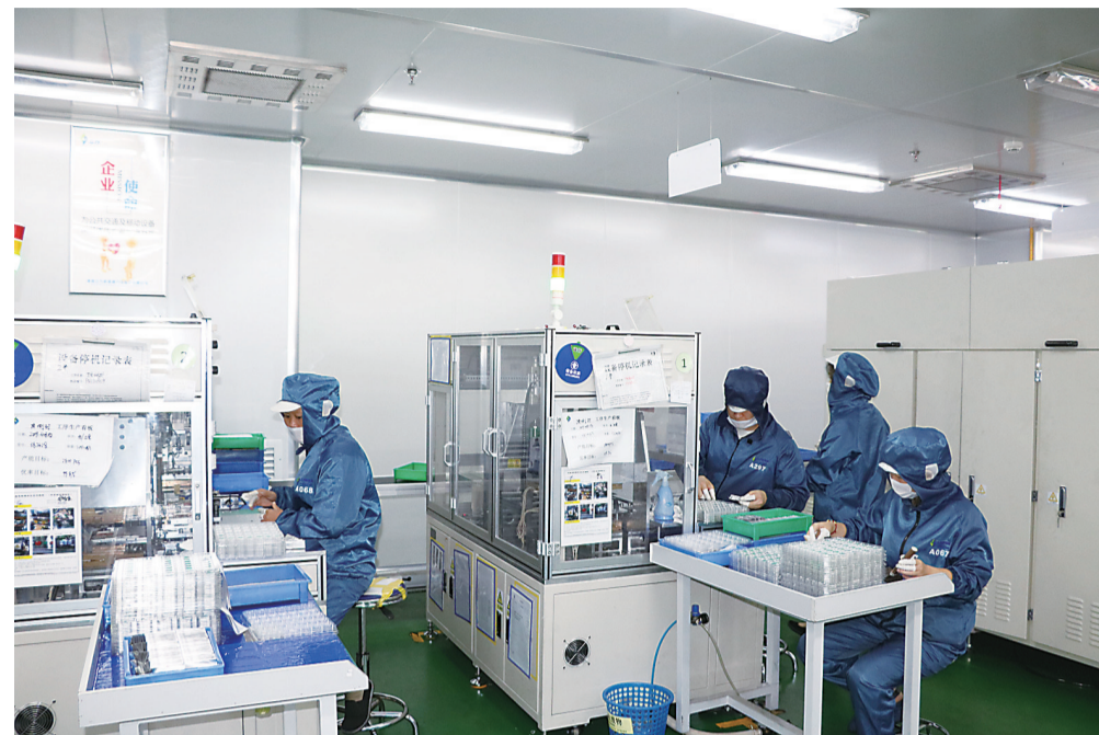
▲立方新能源公司生产场景