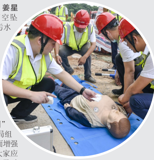
▲救援人员对昏迷人员进行止血、心肺复苏等工作

这是为贯彻落实“安全生产月”活动要求,项目承建方中交二航局组织的一场应急演练。“演练旨在全面增强工作人员的安全生产意识,提高大家应急救援能力,确保一旦发生事故能及时有效开展救援和疏散,将事故的伤亡和损失降到最低,同时加深作业工人对消防安全知识的认识 and 了解,增强全员安全意识。”项目负责人陆亚介绍,中交二航局将一如既往地严格要求安全生产的