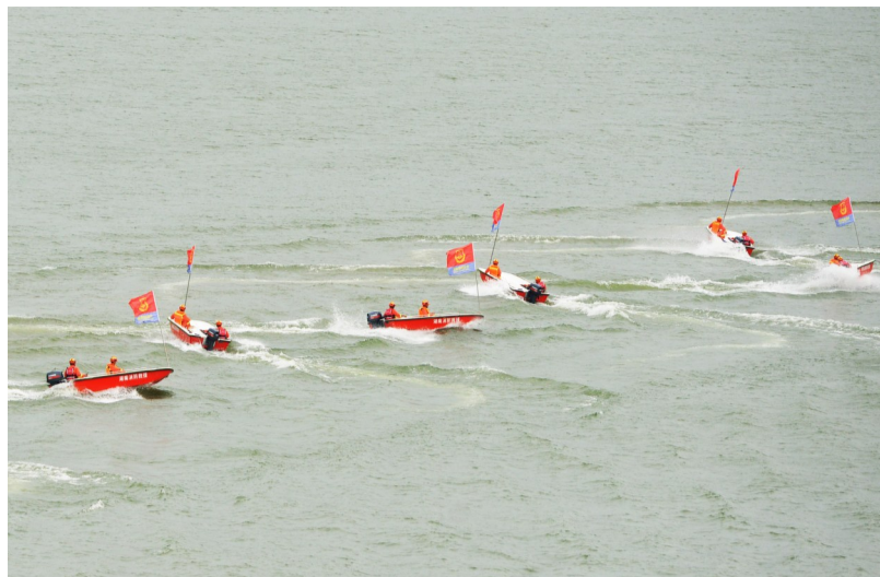
▲演练现场,救援装备吸引眼球