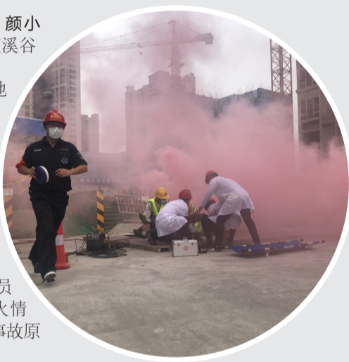
▲各组第一时间抵达现场,各司其职

这是市质安站和“湖南高岭建设”共同组织的一次建筑施工生产安全事故应急演练。“通过应急演练检验项目应急预案的科学性、针对性及实用性。”市质安站站长郭峙说,质量和安全是建设工作的生命线,全行业要努力把一切安全隐患消除在萌芽状态,尽最大可能防止事故发生。