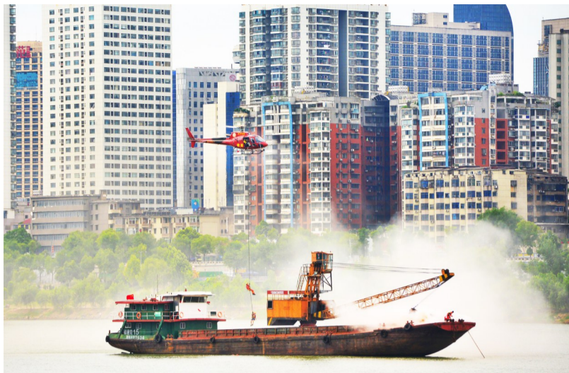
▲救援人员从高空索降,成功救起被困人员,并将火扑灭