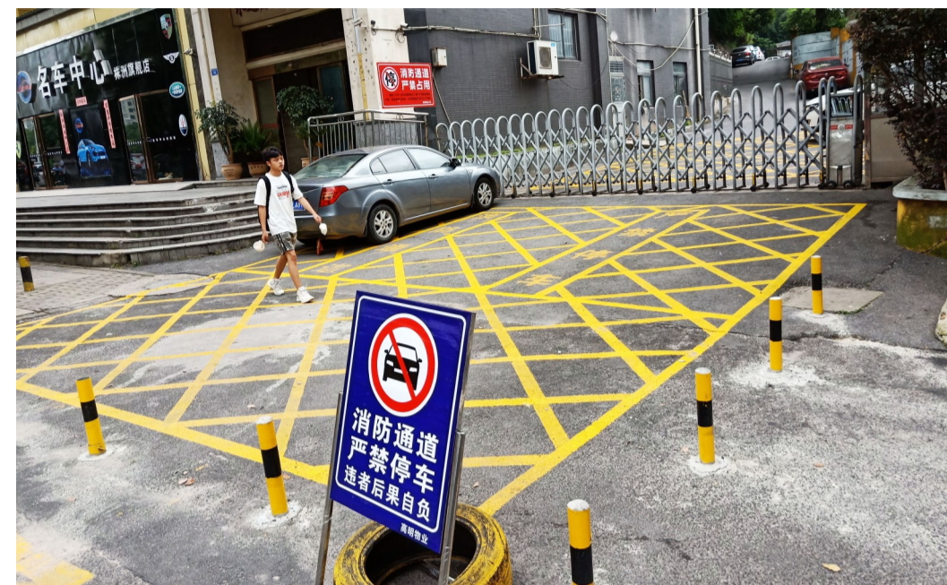
▲6月19日早上,印象华都小区,一辆“特权车”停放在消防通道上

近日,石峰区印象华都小区业主沈女士拨打晚报新闻热线28829110反映:我们小区的消防通道被物业人员设置了隔离桩,还是有少数私家车停在这里。因为有两个隔离桩是活动的,要用钥匙才能打开,难道是物业公司给了这些车主特权?