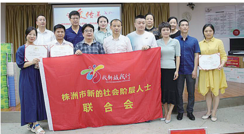
▲爱心人士在九方中学合影

株洲市统战部副部长蔡平还走进该校高三年级宏志班,为即将走进高考考场的高三学子加油打气。他曾是考生家长的身份对高考考生们温馨提示,一定要保持良好心态,注意锻炼身体,积极应对高考。作为宏志班的学生,更要加强知识学习,成为品德高尚的人,将爱心传承下去。