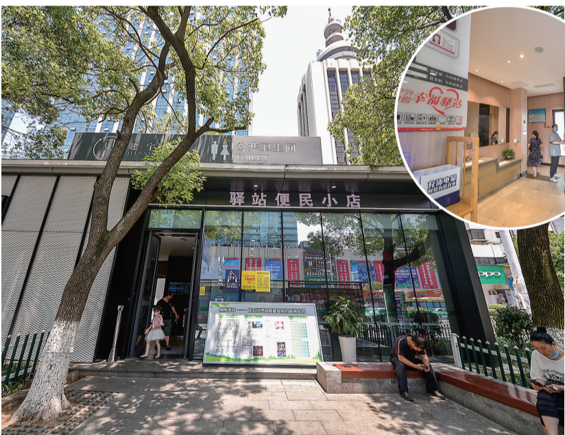
中心广场建宁驿站。

厕所200座、对外开放社会公厕200座。在“街两旁、江两岸、桥底下、公园里、社区中”，一座座简洁大方又不失现代气息的建宁驿站拔地而起。