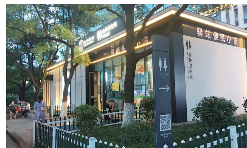
▲中心广场建宁驿站

正是为了解决居民遇到的如厕难题,2018年8月22日,《株洲市城区“厕所革命”(2018—2019年)实施方案》下发。此后,按照“街两旁、江两岸、桥底下、公园里、社区中”的选址原则,株洲将建宁驿站建在居民人流量最多、居民最有需要的地方;新风系统、共享雨伞、便民服务……功能的革新与贴心,改变了人们对厕所“脏、乱、臭”的固定印象,邻避效应成了利邻效应,甚至还有小区、学校争相希望建宁驿站落户。