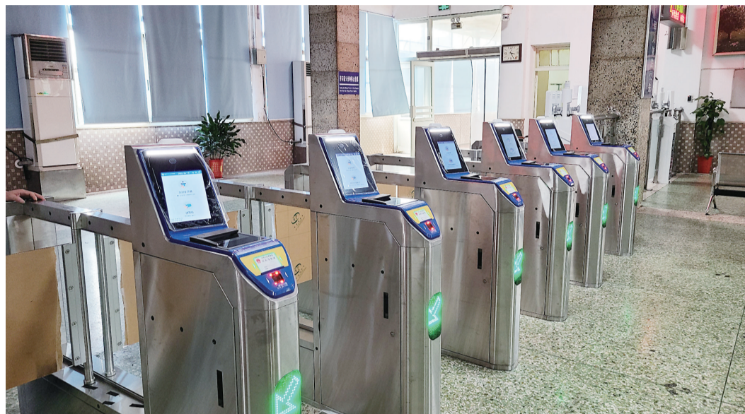
▲株洲火车站为实施电子客票新安装了闸机

本报讯(记者 肖蓉 通讯员 詹旋)记者从株洲火车站获悉,6月20日起,电子客票将在全国普速铁路推广实施,覆盖1300多个普速铁路车站。届时,株洲火车站也将实施电子客票,为旅客提供“一证通行”的便利。