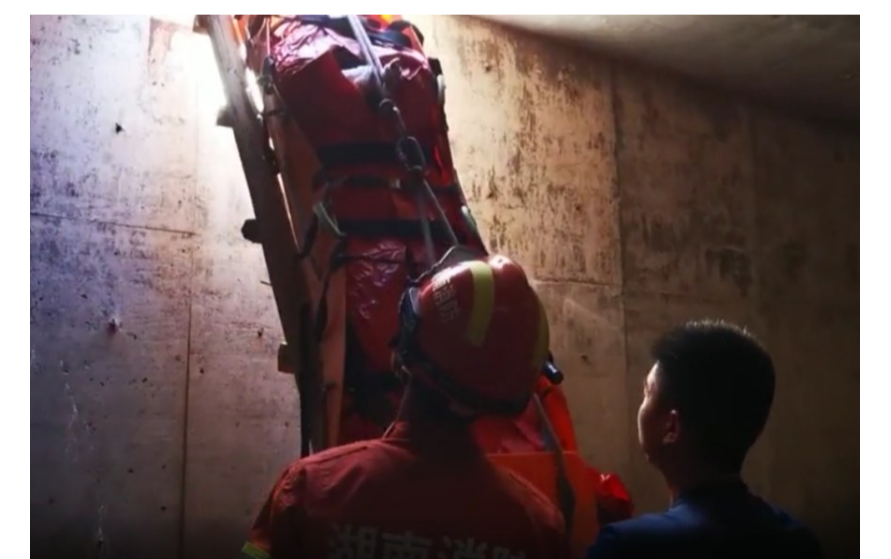
▲伤者被移至安全气囊内,消防员将他拉到池外

本报讯(记者 刘玺 通讯员 陶广礼 谭述毅)6月15日上午,天元区新马路附近一工地内,一名工人不慎跌入未储水的消防水池,导致全身多处骨折。