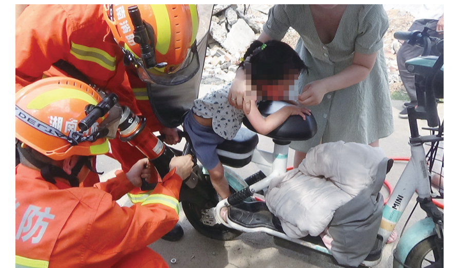
▲女童右脚被卡在后轮与车轴之间,消防正在救援

本报讯(记者 刘玺 通讯员 陶广礼 吴川)前日下午,淞口区淞口镇双月村,一名坐在电动自行车后座的4岁女童出于好奇,将右脚伸进后轮与车轴之间的缝隙,导致脚部被卡,还好被淞口消防部门成功救出。