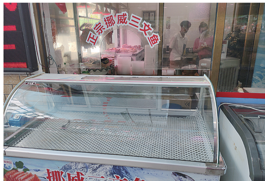
▲6月15日,天纺农贸市场,商家主动将三文鱼下架

随着北京新冠肺炎疫情的发展,三文鱼被推上了风口浪尖。6月15日,记者走访株洲市海鲜市场及多家超市,发现走访到的商超、农贸市场均已紧急下架三文鱼。