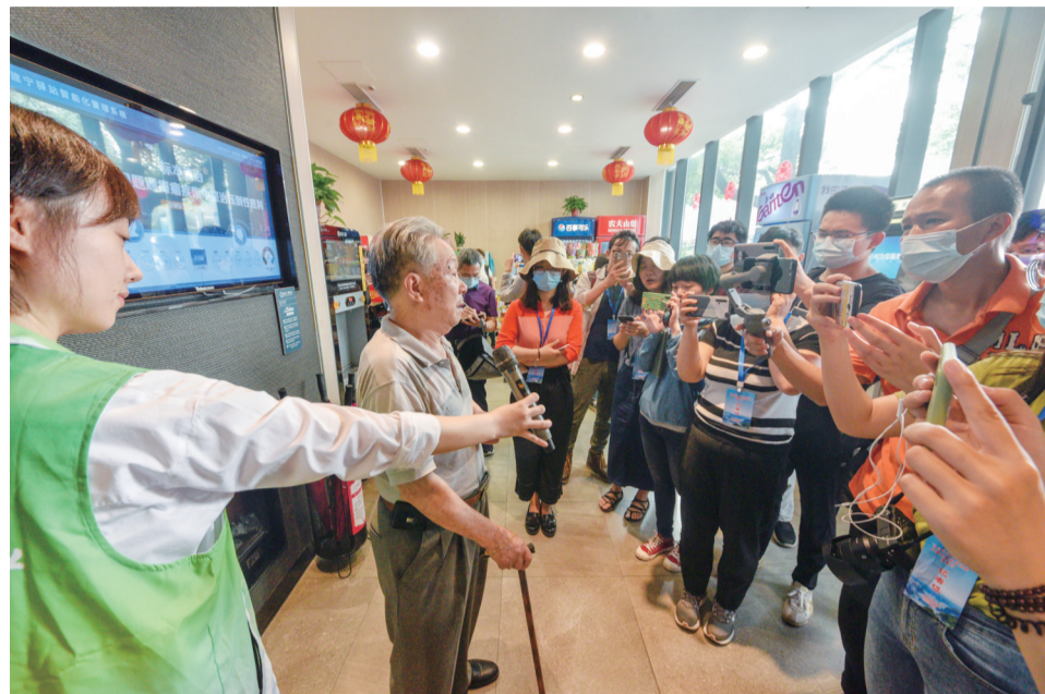
▲6月14日,中宣部“走向我们的小康生活”采访团探访我市建宁驿站(中心广场电信大楼前)

本报讯(记者 周嵩)小康不小康?群众最有话语权。昨日,中宣部“走向我们的小康生活”大型采访团走进株洲,深入建宁驿站、老旧小区加装电梯等现场,用镜头与笔触,聚焦株洲高质量发展成果,探访株洲市民幸福而真实的小康生活。