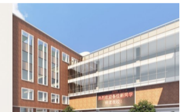
▲图为白鹤菱溪小学校园 汪睿雅 供图

学校为总投资约5亿元,为九年制义务教育公办学校。设计办学规模为小学60个班、初中45个