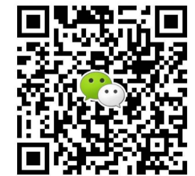
扫一扫上面的二维码图案,加我微信