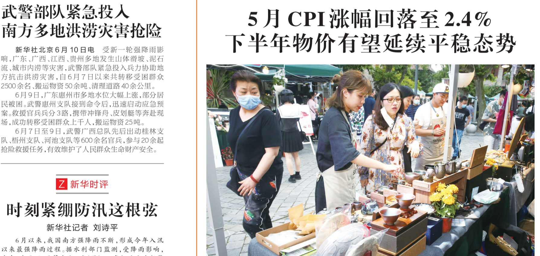
一些顾客在上海市思南公馆集市选购小商品。