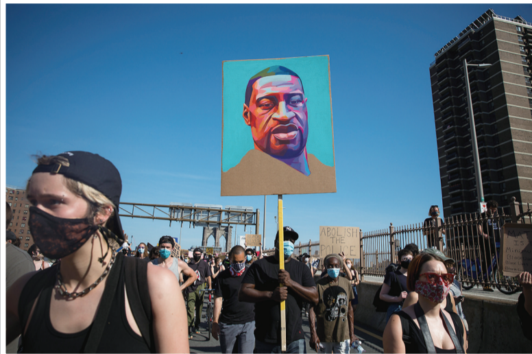
▲6月9日,抗议者手举弗洛伊德的画像在纽约街头参加抗议活动