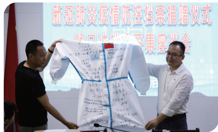
▲市人民医院向市档案馆捐赠援鄂医疗队防护服。

株洲日报讯 6月9日是第13个国际档案日,也是市档案馆开放日。为进一步增进档案工作与社会公众的互动,增强全社会的档案意识,当日,市档案馆邀请数十名医护人员、社区工作人员、志愿者走进市档案馆,开展2020国际档案日系列宣传活动。