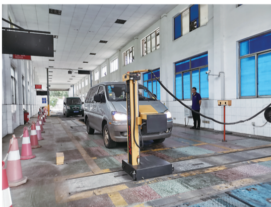
▲市机动车检验站内机动车正在进行检测