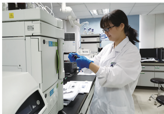
▲云天检测的工作人员正在利用仪器设备对样品进行分析