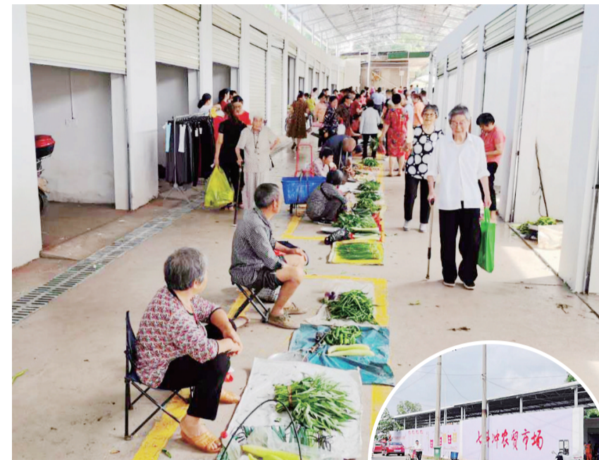
▲新建的农贸市场能遮风避雨,安全也有保障