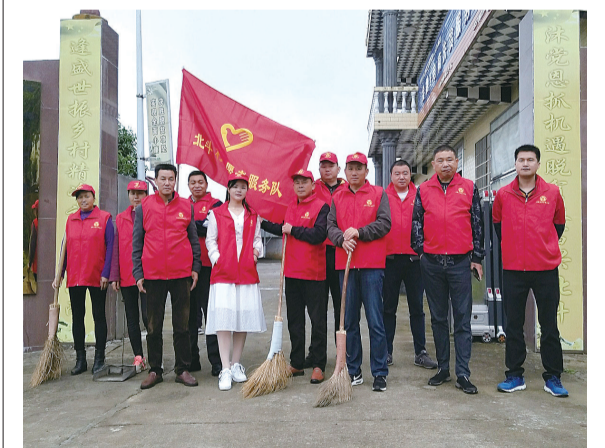
北斗村志愿服务队参与人居环境整治

截至4月,该镇2020年第一季度26户乡镇级最美庭院、391户村级最美庭院全部授牌表彰到位。在最美庭院的示范带动下,全镇村民纷纷做好家庭房前屋后卫生,以家家户户的干净整洁,提升镇容村貌。