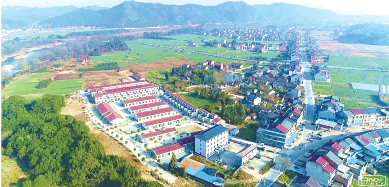
俯瞰下的湖口镇美如画