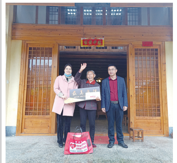
“百佳最美庭院”授牌

悠悠天宇旷,切切故乡情!今天的湖口,历经农村人居环境整治,一个个村庄亮丽秀美,如颗颗繁星在冰水之滨闪烁。