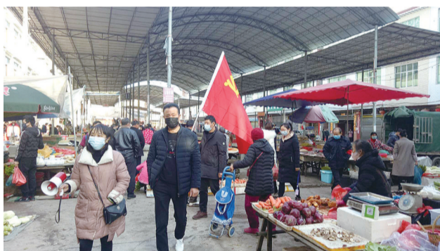
对集镇进行常态化督导整治