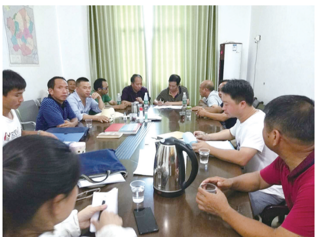
各村(居委会)干部来妙石村交流取经