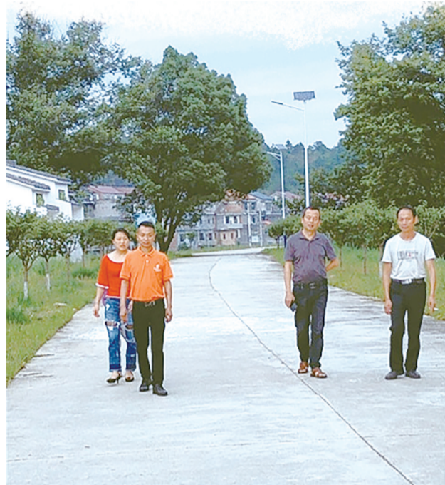
樱花大道成为小潭村村民散步好去处