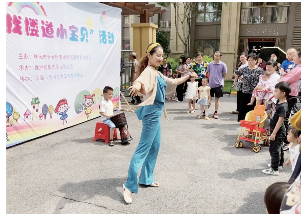
▲活动现场,社区居民表演亲子节目

本报讯(见习记者 黄欣雨)6月7日上午,由天元区泰山路街道谢家冲社区主办,晚报志愿者联合会承办的“寻找楼道小宝贝”活动在天元区奥园广场小区举行,为2020年谢家冲社区“红色楼道”项目拉开了序幕。