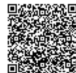
▲扫码购买李子柒龙舟飘香粽,助力公益助学