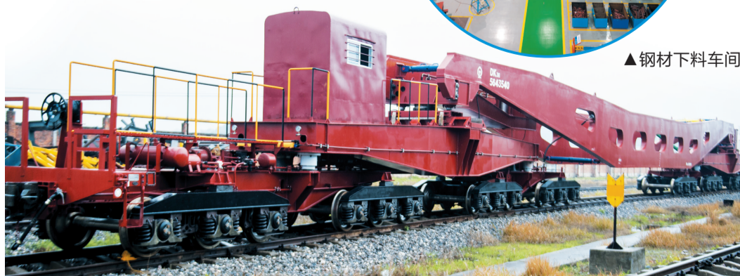
▲载重360吨大型特种设备运输车