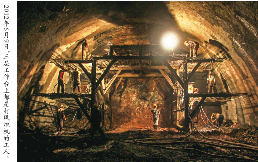
2012年6月9日,三层工作台上都是打风炮机的工人。