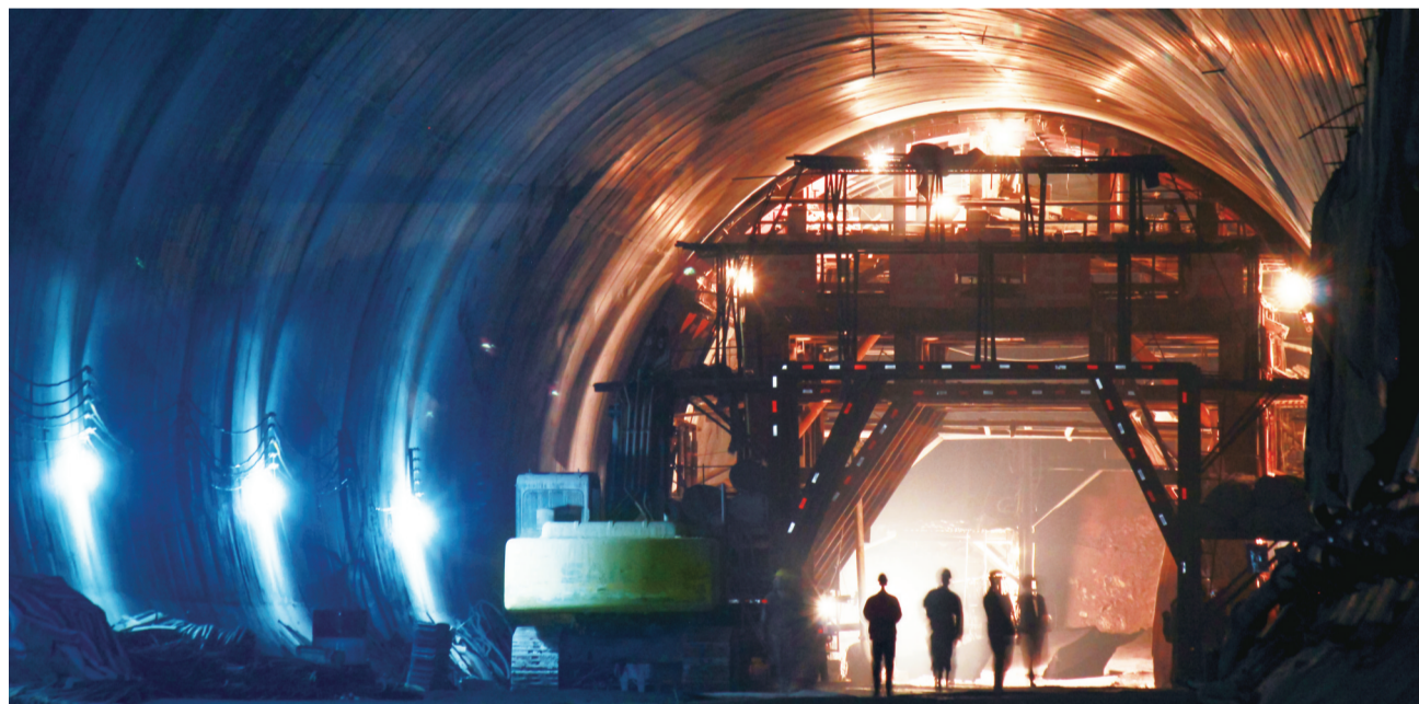
2013年1月16日,结束上午的工作,施工人员撤出施工面准备去吃午餐。