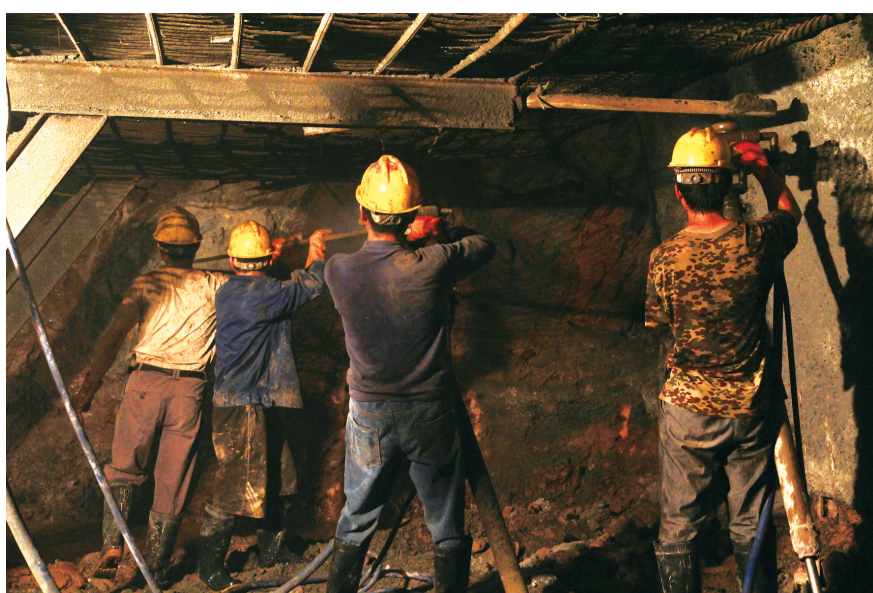
2012年6月9日,风炮机打孔是两人一队,一个掌控机器,一人掌控钻杆。