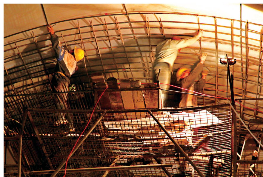
2013年1月16日,工人正在隧道顶部架设钢筋。