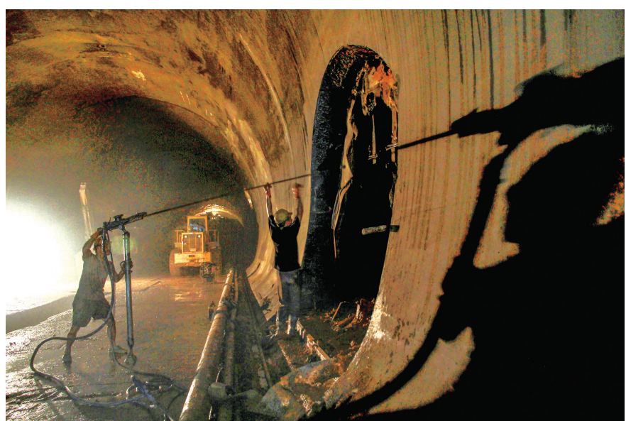
2012年6月9日,工人在用风炮机钻孔。