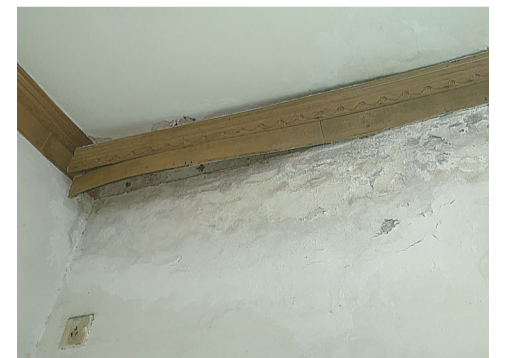
▲文阿姨家的墙缝存在明显的水渍痕迹

随后,记者电话联系上了周先生,当天下午他赶了过来。文阿姨和周先生现场查看了周先生家里