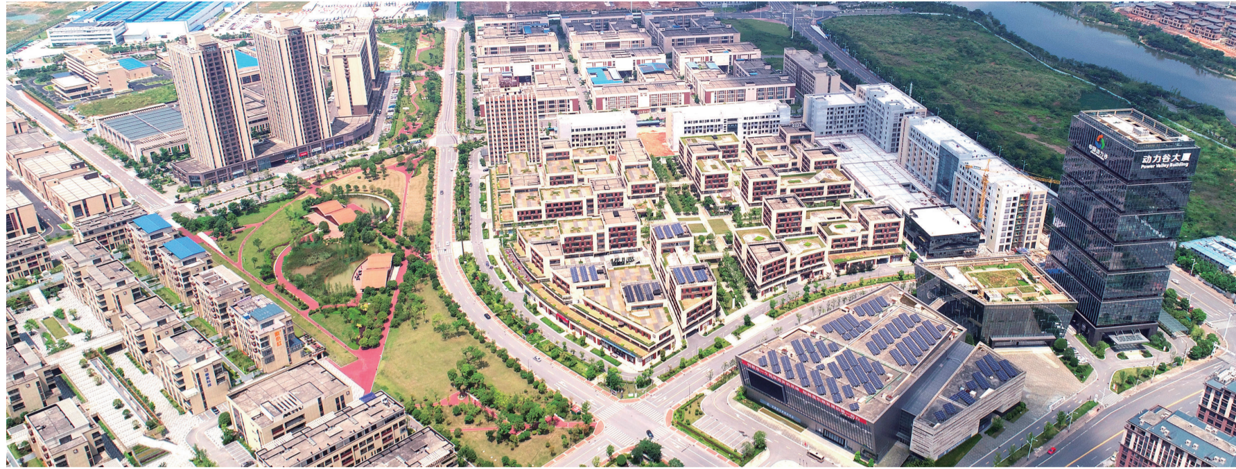
▲美丽的动力谷园区