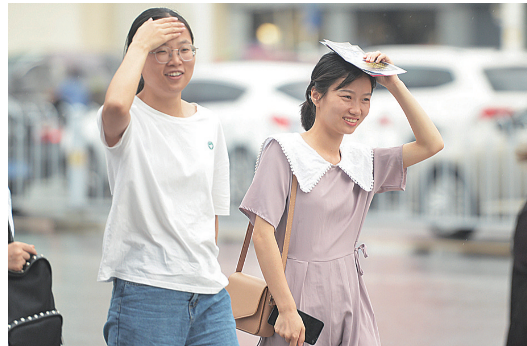
▲6月4日,新华路,一场阵雨过后,刚刚下班的市民开心地向中心广场走去