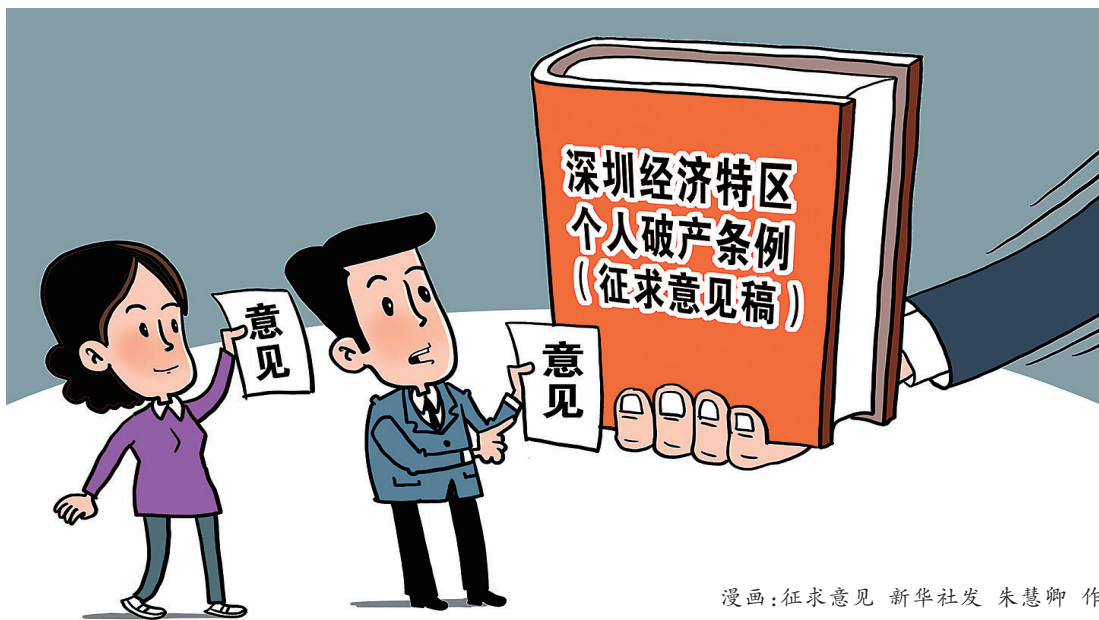
漫画:征求意见 新华社发 朱慧卿作

曹启选表示,个人破产制度最本质的意义是救济,“诚实”“不幸”是申请破产的两个关键词。这意味着,只有诚实守信的债务人,在不幸陷入债务危机时,才能获得个人破产制度的保护,并帮助其从债务危机中解脱出来,重新参与社会经济活动,创造更多财富。