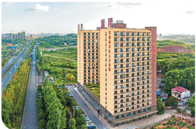
▲株洲经开区人才公寓

株洲云龙示范区自2009年4月18日挂牌成立以来,始终坚持“两型”引领,探索未来城市发展方向,探求株洲老工业城市转型发展新路,加快推动长株潭一体化发展。2017年,云龙示范区与株洲经开区两块牌子叠加优势,激活“融城先发”新引擎,开启“二次创业”新征程,尤其是在引进项目,培育龙头,形成产业链,打造产业集群方面,云龙一直在全面布局。