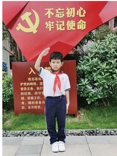
桐睿从小懂事,去年进入二中附小读一年级,昨日首批入队。他说加入少先队很激动,一定要努力学习,长大了报效祖国。