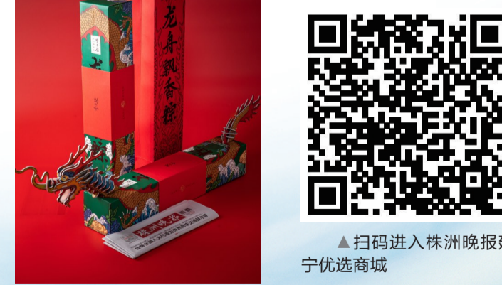
▲扫码进入株洲晚报建宁优选商城