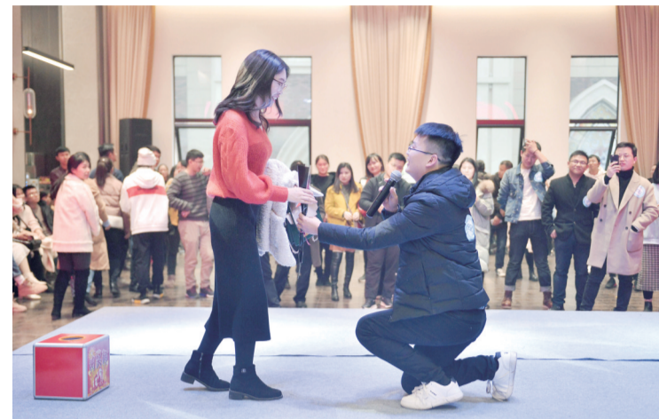
▲2019年,绿地21城相亲活动现场

2019年,晚报融媒体中心在“晚报红娘”的基础上,成立专门团队,制定了扩大社群运营的规划,开发线上交友社区,搭建了内容全面的线上相亲平台,一站式实现青年交友、情感交流、学习需求。全年组织了线下活动21场,其中500人规模的大型联谊4场,百人规模的中型联谊6场。今年5月23日,随着100名单身青年酒仙湖浪漫相约落下帷幕,晚报红娘2020年大型线上线下婚恋交友活动顺利收官。活动反响热烈,通过前期筛选,共有600余人顺利参加活动,获得交友机会。通过一系列线上线下活动,我们与株洲各领域和企事业单位青年团体建立了紧密的联系,打造了一个权威、可靠、高效的公益相亲平台,在株洲市场赢得口碑。