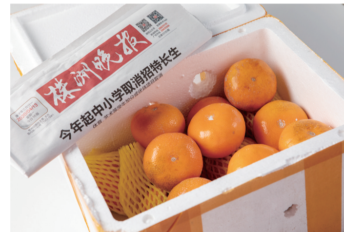
▲建宁优选商城商品,都要经过线下测评才能上架

2020年6月1日,是株洲晚报创刊20周年纪念日,株洲晚报官方商城“建宁优选”正式上线。“建宁优选”致力于以株洲日报社丰富的政商及媒体资源,整合品牌渠道,打通线上线下,链接千个小区,赋能实体店,打造社区新零售旗舰,为消费者提供高性价比精选商品,助力实体店获取超额收益。目前,“建宁优选”商城已与国内外众多知名品牌、银行、物流达成合作,“报业+社区+电商”的新模式,正快速发展。