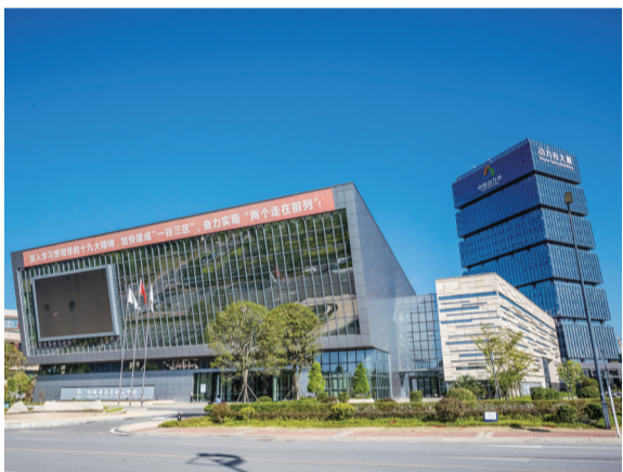
▲动力谷自主创新园