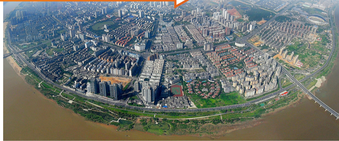
▲高新区全景图

株洲高新区,生机勃勃,工厂车间内机器轰鸣,生产线加速运转;项目建设工地吊机长臂挥舞,挖掘机来回奔忙;街头巷尾商超小店开门迎客,商贸活力区,人气回归……在“奋战一百天,实现双过半”号角的鼓舞下,在这里更加灵动;志愿服务礼遇褒奖办法,打出就业“组合拳”,菱溪中学、菱溪小学、隆兴中学等新学校将陆续投入使用,“教育为本”得到深刻实践……一桩桩、一件件惠及民生的大事实、大好事,在这里持续奏响。 一头链接产业,一头关乎民生,株洲高新区,正加速奔跑。从容中孕育巨变,安静里澎湃伟力,株洲高新区,每一天都是新的。