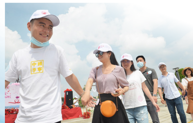
▲今年5月23日,晚报红娘组织100名单身青年在酒仙湖浪漫相约

2019年,晚报融媒体还联合市委宣传部、市教育局、市妇联、市文明办一起开展了株洲首届微家书活动,浏览量近120万,点赞数近12万;联合“株洲站改办”开展了“我与株洲火车站”征文征图,社会反响良好。