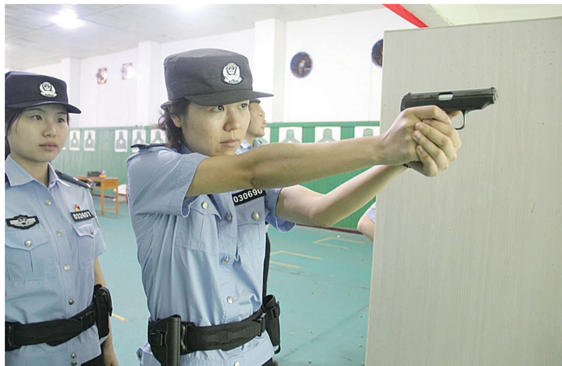
▲大练兵射击项目进行中

为认真贯彻落实上级部门全警实战大练兵工作要求,切实提升队伍整体素质,练就过硬本领,5月,天元公安分局(以下简称“分局”)“全警实战大练兵”拉开序幕。 此次大练兵,从5月伊始将贯彻全年,要求坚持以“训练即实战”的理念,从实战需要出发,加强岗位练兵,开展分类施教,坚持做到术业专攻,全面推动全警综合素质不断提升。