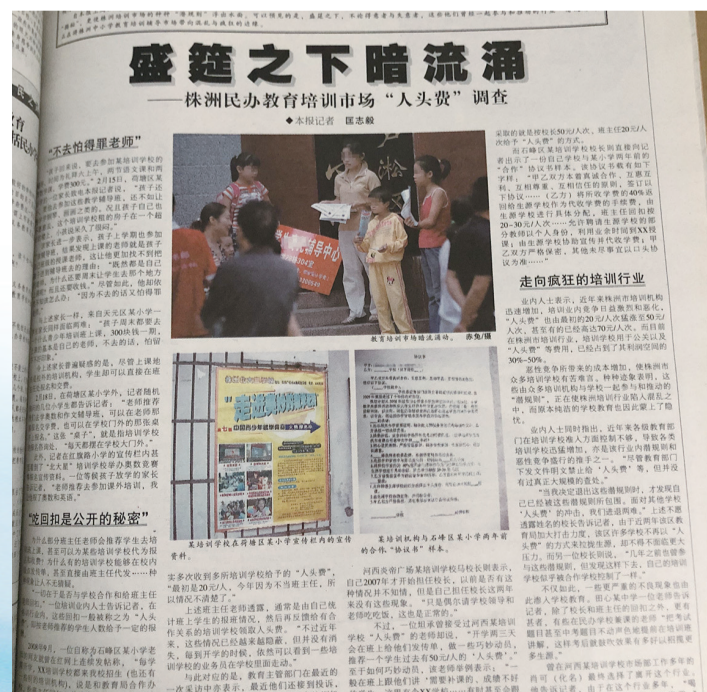
▲老师向培训学校推荐生源收回扣

《一条加重学生负担的灰色利益链》:部分教辅书店与学校或老师暗中勾结,学生不得不到指定的书店购买教辅书。