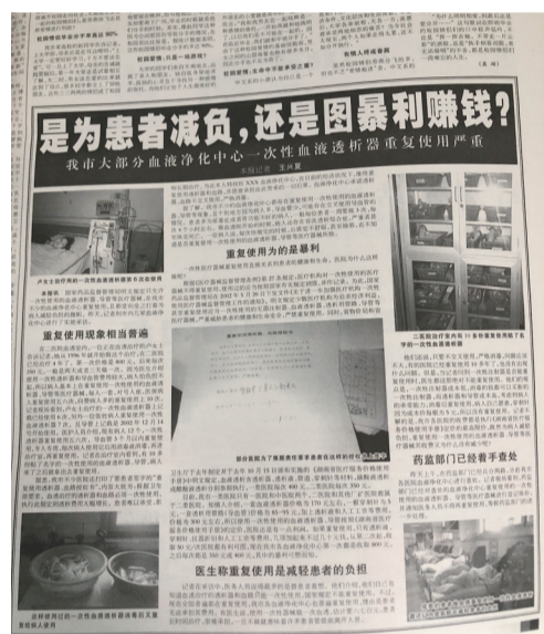
▲一次性血液透析器重复使用