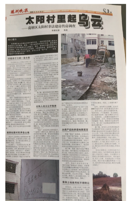
▲太阳村非法建房一事被曝光

《荷塘区环卫处“果皮桶”采购起风波》:2008年6月15日,本报刊发报道,荷塘区环卫处果皮桶的采购价格,远远高于记者暗访采购同类产品价格,其中原因,引人怀疑。《“签单主任”卸职,留下满街赊账》:2008年12月,本报刊发报道,芦淞区