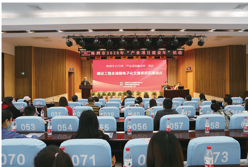
▲我市举办全流程电子化交易系统实操培训

新冠肺炎疫情发生以来,株洲市公共资源交易中心(以下简称“中心”)一手抓疫情防控,一手抓交易工作,以信息化建设为抓手,统筹完善平台服务功能,加快推进全国文明单位创建,大力帮扶企业复工复产,服务株洲经济发展大局。