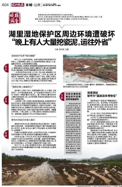
▲湖里湿地周边环境遭破坏

《“天旺”屠宰场,难道真的没人管得住?》:位于芦淞区的天旺屠宰场,因为噪音、气味、污水乱排放等原因,多次遭到居民投诉。执法部门在查封该屠宰场后,负责人居然撕掉法院封条