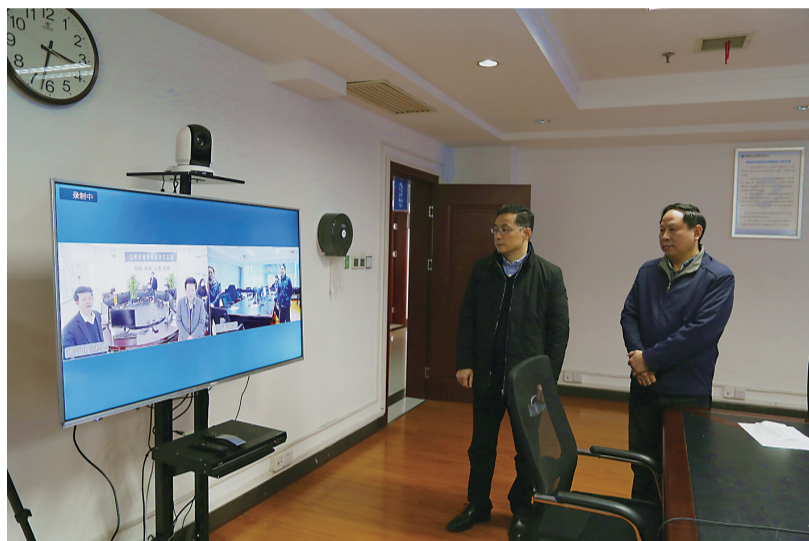
▲长株潭三市首次应用5G技术完成政府采购项目远程异地评标