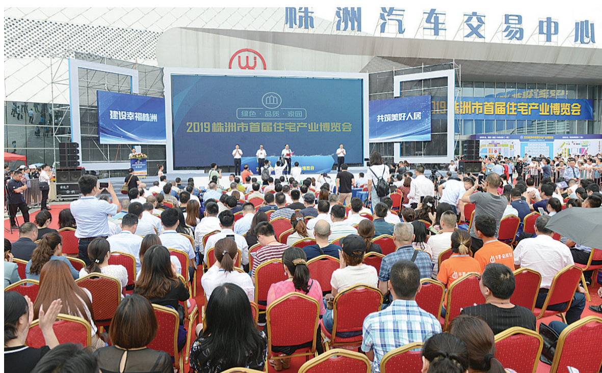
▲2019年株洲市首届住宅产业博览会活动现场

一份报纸必须有一批优秀的记者编辑为之支撑,他们须有胆识、才气和情怀。同样,也需要有一批辛勤的经营人员来实现“为市民服务”的理念,他们须有激情、责任和干劲。正因为此,株洲晚报才有一个又一个的品牌活动,从“春季购房节”到“汽车博览会”,从“千人相亲”到“婚博会”……既让市民买得放心实惠,又让商家卖得安心满意,取得社会效益和企业效益双丰收。 天空没有留下翅膀的痕迹,但我已经飞过。20岁,我们正年轻,再出发。