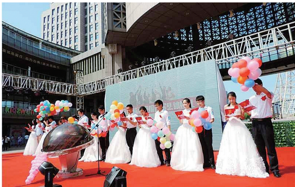
▲2015年株洲晚报结婚采购大会暨首届湖南·株洲婚庆文化嘉年华活动现场

其中2014年的车展,展会面积达到14000平方米,有60多个车品牌展出,参展车型超过500个,吸引超10万人次的市民到现场看车,销售车辆超2000台,拉动消费过亿元,将株洲车博会的水准提升到一个新高度。