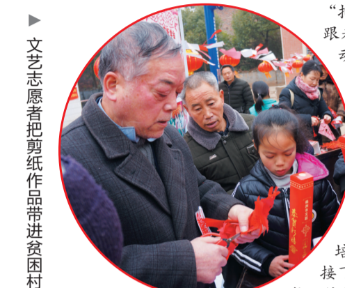
文艺志愿者把剪纸作品带进贫困村

“把手臂打开……跟着节奏……一起动起来!”随着市舞蹈家协会指导老师的口令,市民们在开阔的场地内翩翩起舞。这是5月23日正式启动的“健康动起来”舞蹈进社区公益培训活动的现场。 接下来的几个月,市舞蹈协将组织100多名文艺志愿者,深入全市40多个机关、企业、扶贫点,为上万名市民群众提供320场以上的健康舞蹈公益培训。这已经是市舞蹈协连续第7年开展舞蹈进社区文艺志愿服务了,所以文艺志愿服务在株洲早已蔚然成风。