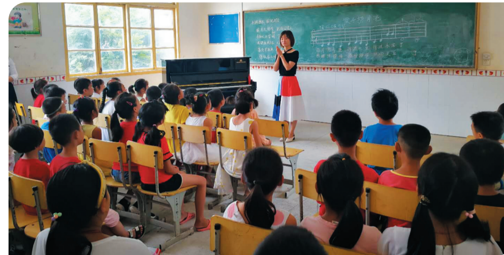
▲志愿者为山村孩子带来了他们的第一节钢琴课

“把手臂打开……跟着节奏……一起动起来!”随着市舞蹈家协会指导老师的口令,市民们在开阔的场地内翩翩起舞。这是5月23日正式启动的“健康动起来”舞蹈进社区公益培训活动的现场。 接下来的几个月,市舞蹈协将组织100多名文艺志愿者,深入全市40多个机关、企业、扶贫点,为上万名市民群众提供320场以上的健康舞蹈公益培训。这已经是市舞蹈协连续第7年开展舞蹈进社区文艺志愿服务了,所以文艺志愿服务在株洲早已蔚然成风。