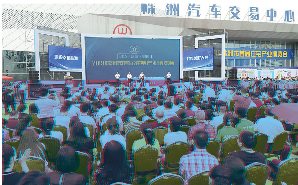
▲2019年株洲市首届住宅产业博览会活动现场

一份报纸必须有一批优秀的记者编辑为之支撑,他们须有胆识、才气和情怀。同样,也需要有一批辛勤的经营人员来实现“为市民服务”的理念,他们须有激情、责任和干劲。正因为此,株洲晚报才有了一个又一个的品牌活动,从“春季购房节”到“汽车博览会”,从“千人相亲”到“婚博会”……既让市民买得放心实惠,又让商家卖得安心满意,取得社会效益和企业效益双丰收。 天空没有留下翅膀的痕迹,但我已经飞过。20岁,我们正年轻,再出发。