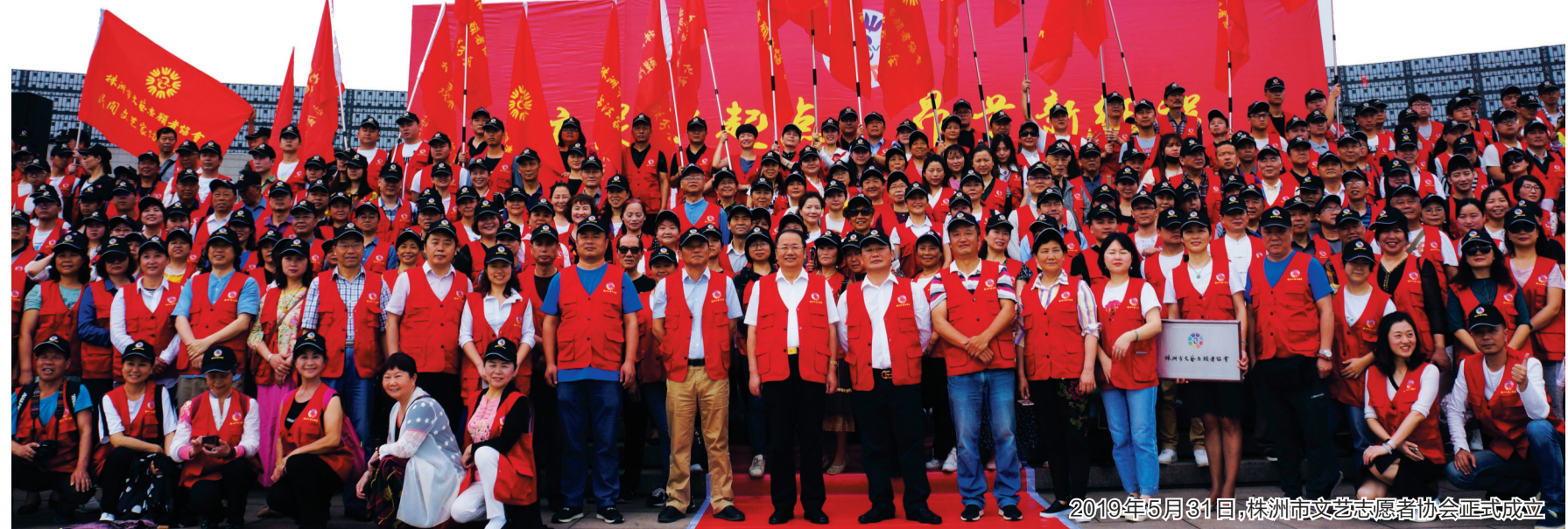
2019年5月31日,株洲市文艺志愿者协会正式成立