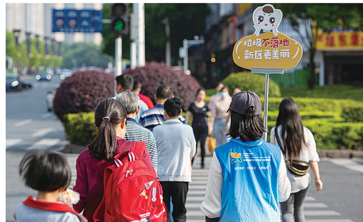
▲天元区推出志愿服务品牌项目“一路有‘礼’”

从一个人的绵薄之力到一群人的事业,从一个人的绵薄之力到大爱汇聚的永续动力,“新区有梦,天元有爱,志愿有我”唱响在新区的每一个角落。志愿服务不再只是大型活动的“偶遇”,而是深入生活的平常,惠及人们的衣食住行。