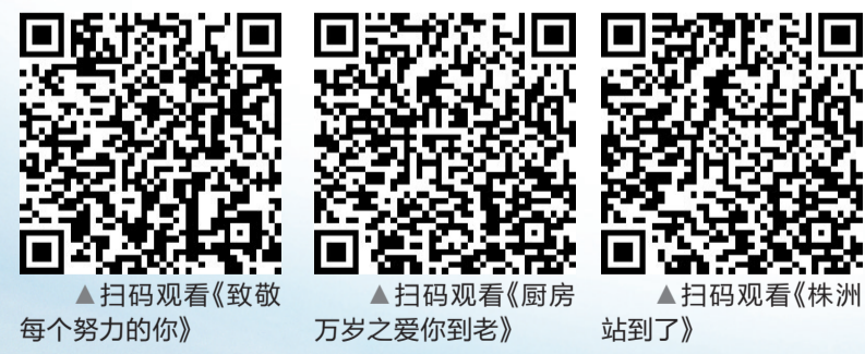
▲扫码观看《致敬每个努力的你》 ▲扫码观看《厨房万岁之爱你到老》 ▲扫码观看《株洲站到了》

传片制作业务,包揽创意、拍摄、剪辑制作等全环节,获高度评价。2020年,株洲晚报将深耕短视频和直播领域,全力冲刺内容转型。晚报融媒的人员、资源配置,都将进一步向视频倾斜,进一步加强视频内容的生产能力,面向全国打造新的视频内容IP,培育本土网红;进一步拓展视频传播渠道,通过微信、抖音、头条、B站等优质平台,提升视频产品影响力。