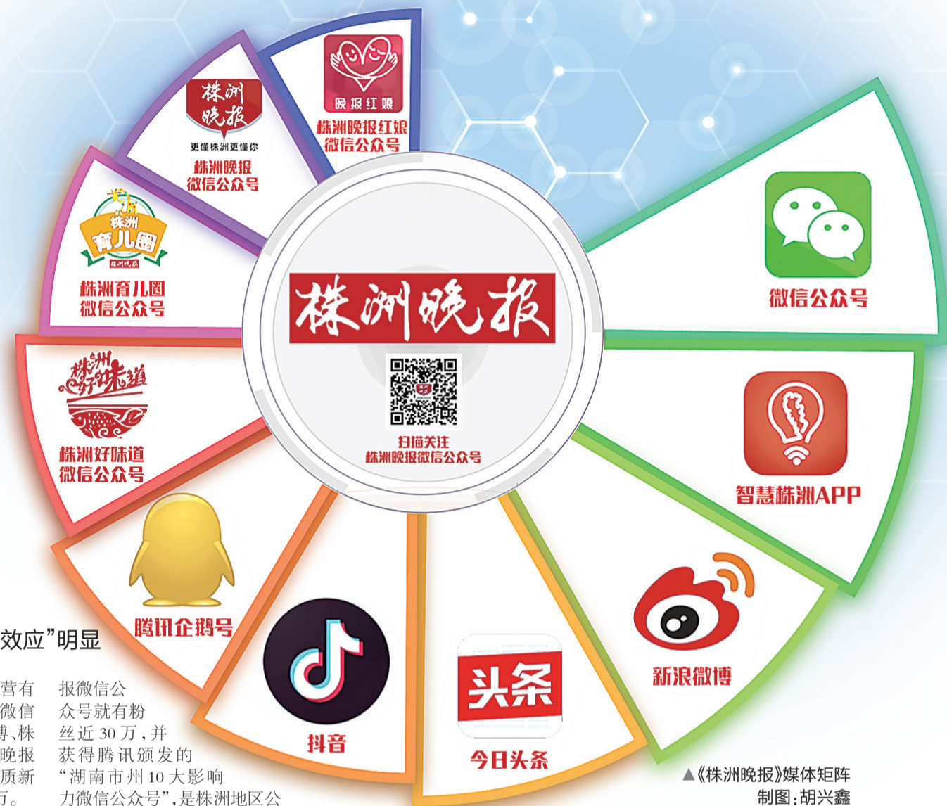
▲《株洲晚报》媒体矩阵 制图:胡兴鑫

随着新技术的不断发展,手机已成为越来越多的受众获取信息的渠道,各类新媒体平台应运而生。近年来,株洲晚报紧跟形势变化,不断推陈出新,实现了信息传播由纸到屏、信息形式由单一到多样、受众关系由单向到双向的转变,融媒体产品集群配合,“生态效应”初显。