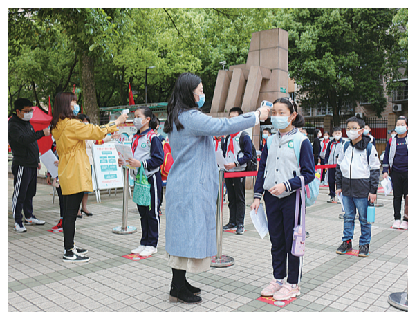
▲白鹤小学采取分年级、分时段错峰开学

2月20日,株洲高新区发布《关于应对新型冠状病毒肺炎疫情影响解决企业用工难题的“六条”奖补政策措施》,围