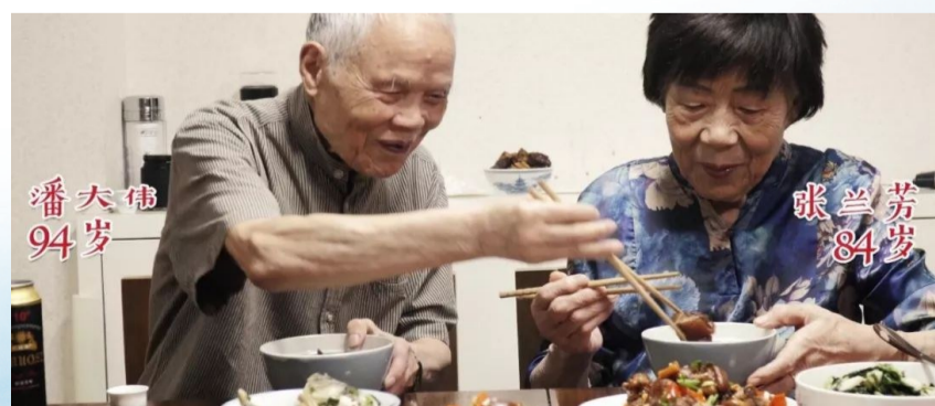
▲《厨房万岁之爱你到老》视频截图