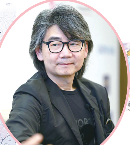
朱德庸作品,选自《绝对小孩》系列。