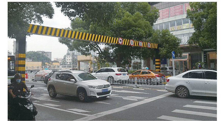
▲新华桥即日起限制超限超载车辆通过

本报讯(记者 刘玺 通讯员 管丽)记者从荷塘交警大队获悉,新华桥限高架已经安装到位,即日起限制超限超载车辆通过。