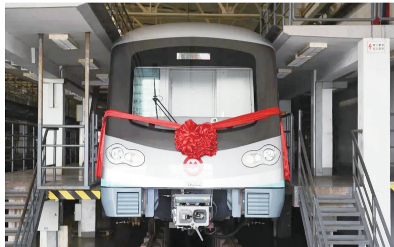
▲上海地铁第6000辆列车交付