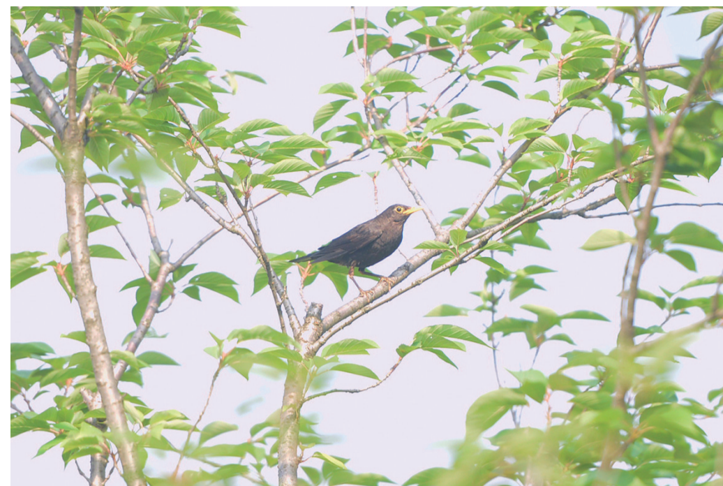
▲5月28日,黄河路,一只小鸟站在枝头上小憩