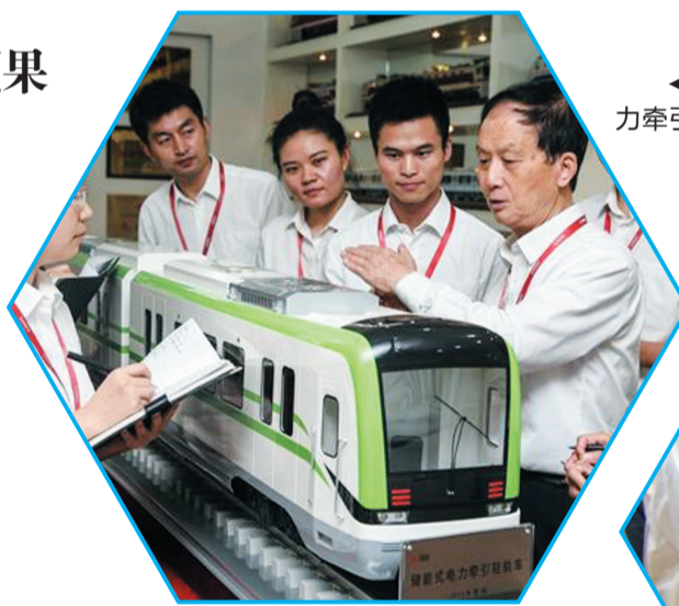
▲刘友梅院士现场解说储能式电力牵引轻轨车运行原理