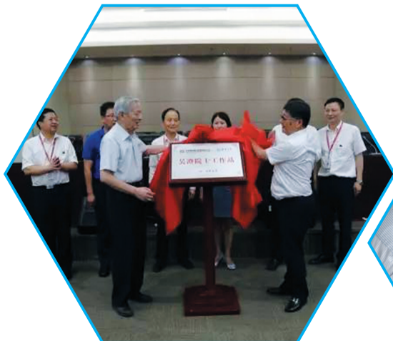
▲吴澄院士工作站揭牌仪式