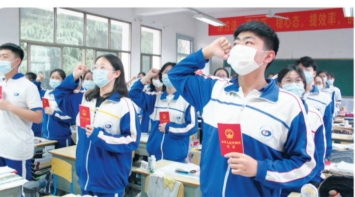
▲高三学子手持宪法，面对国旗庄严宣誓

多年来，市四中不忘初心、不负使命，高举党建旗帜，践行“三红”工程，开创“三优”管理，精育“三雅”学子，助推教育事业发展。