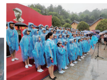
▲左权红军小学的孩子们雨中合唱《左权将军之歌》 ◀4D打造的百团大战场景

1905年3月15日,伟大的无产阶级革命家、军事家、抗日英雄左权出生在左家老屋。淡黄色的仿土坯房、灰白色的瓦片,这座民国初期风格的建筑,处处流露着上世纪初古朴的民风。进入屋内,左权将军的铜质雕像静静地矗立眼前,他身后所雕刻的浮雕,是他最后战斗牺牲的大太行山脉。两旁的悼诗,是朱德总司令在听闻左权牺牲时亲笔撰写的。铜像右侧,分别是由彭德怀撰写的《左权同志纪念碑》和周恩来撰写的《左权精神不死》的摘录。 左家老屋由主厅、左权生平业绩陈列室,以及还原了左权将军幼时生活环境的复原陈列室等部