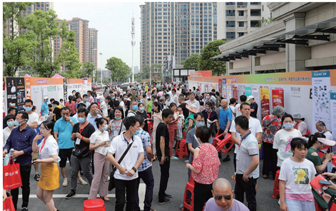
▲“享政策,购建材,得实惠”活动启动仪式现场

本报讯(记者 周嵩)提振消费市场活力,让市民得实惠。昨日,由市住建局联合市装饰协会、市物业协会联合举行株洲分行共同举办的“享政策,购建材,得实惠”活动正式启动。根据活动安排,即日起至8月8日,市民在购买指定品牌的建材商品,最多可使用5600元消费券,还有可能获赠1600元物业费。